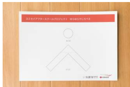
1. あつがみにだいをいんさつする。