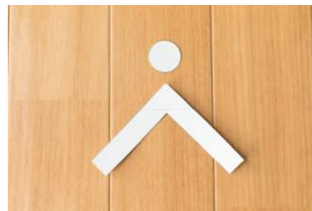
2. あたまとからだをきりぬく。