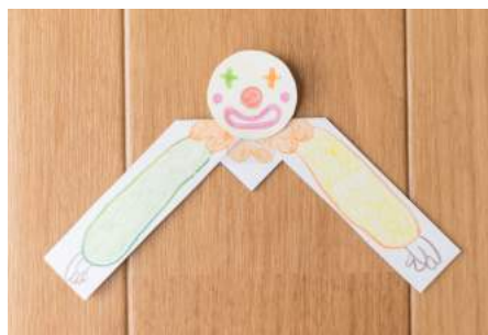
5. あたまとからだをセロハンテープでとめる。