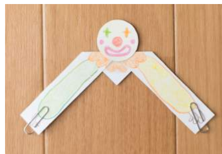
7. うでのさきにクリップをつけてかんせい！