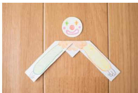
4. からだをうらがえす。あたまとからだにすきなえをかく。